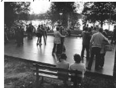
Ainola, Jyväskylä.